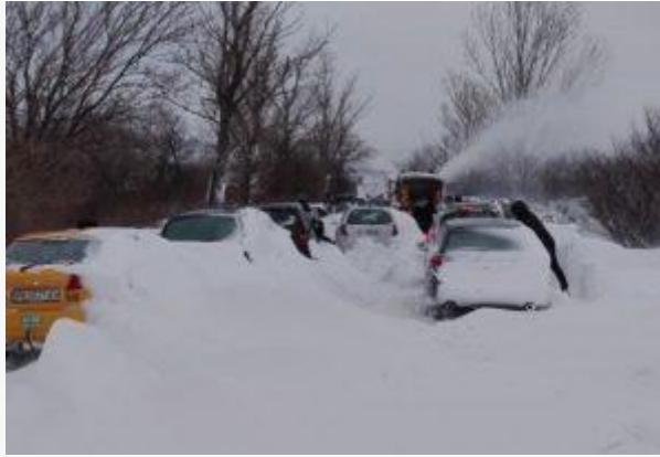
Пътят Карнобат – Айтос на 31.12.2016 г.

През 2016 г., поради обилен снеговалеж, повече от 15 часа десетки автомобили остават блокирани на пътя Бургас – Карнобат. Налага се военна техника да се включи за разчистване на пътя. Участници в спасителната акция свидетелстват, че въпреки многобройните съобщения за тежката ситуация, автомобили са продължавали да влизат в „снежния капан“ през цялото денонощие. Подобни ситуации са критични и могат да костват човешки живот. Не ги подценявайте!